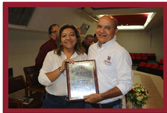
Docentes recibiendo su reconocimiento